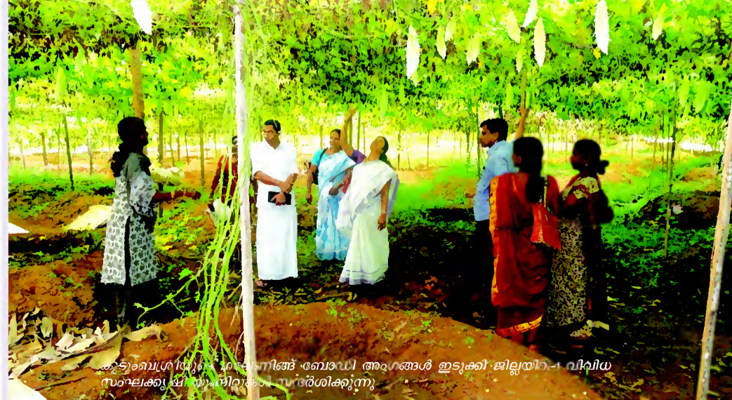
കുടുംബശ്രീയുടെ ഗവേണിങ് ബോഡി അംഗങ്ങൾ ഇടുക്കി ജില്ലയിൽ വിവിധ സാലക്കുടി തുണിനടവൃത്തിയിൽ പങ്കെടുത്തു

കുടുംബശ്രീ ഉല്പന്നങ്ങൾ മൊത്തമായി വാങ്ങാനും വാതരണം നടത്താനും താൽപര്യമുള്ളവർ മാർക്കറ്റിംഗ് ടീമുമായി ബന്ധപ്പെടുക ഫോൺ : 9895896716, 9946121217