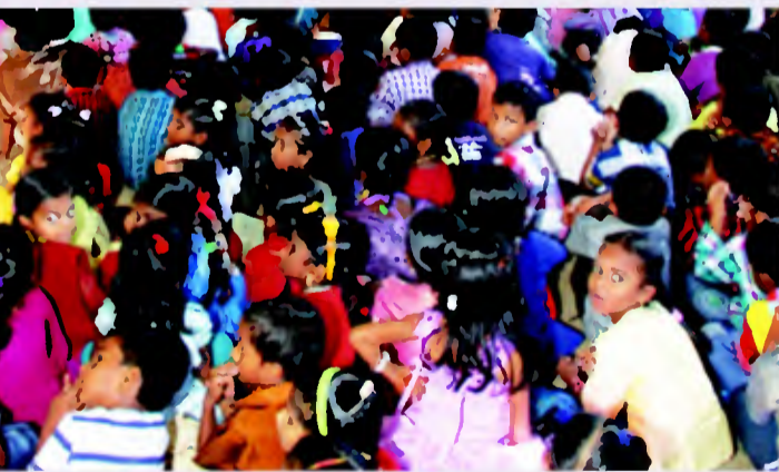
ജീവിതം വരയ്ക്കുന്ന കുരുന്നുകൾ: എന്റെ വീട് എന്റെ അയാൾപക്കം എന്ന വിഷയത്തെ ആസ്പദമാക്കി നടന്ന ചിത്രരചനാ മത്സരത്തിൽ പങ്കെടുക്കുന്ന വിഴിഞ്ഞം കടലോരചേരിയിലെ കുട്ടികൾ

ട്ടിൽമുക്കി ചിത്രീകരിച്ചപ്പോൾ സംഘാടകർക്ക് കൂടുതലൊന്നും അമ്പേഷിക്കേണ്ടിവന്നില്ല. ചേരിപരിഷ്കരണപദ്ധതിയുടെ ഭാഗമായിട്ടായിരുന്നു ചിത്രരചനാമത്സരം സംഘടിപ്പിച്ചത്. വിഴിഞ്ഞം കടലോര ചേരികളിലെ നിവാസികൾക്കിടയിൽ സാമൂഹികാവശ്യം വിലയിരുത്തുന്നതിനായി കുടുംബശ്രീ നടത്തിയ സാമൂഹിക സർവ്വേയുടെ ഭാഗമായിരുന്നു ഈ പരിപാടി. കുട്ടികൾ തങ്ങളുടെ അടിസ്ഥാന ആവശ്യങ്ങൾ ചിത്രങ്ങളുടെ ഭാഷയിൽ അധികാരികളുടെ മുന്നിൽ നിരത്തിയപ്പോൾ അത് അർത്ഥപൂർണ്ണമായ ഒരു വിലയിരുത്തലായി മാറി. 1038 കുടുംബങ്ങളിലായി 5000 തോളം വരുന്ന ജനങ്ങൾ തിങ്ങിപ്പാർക്കുന്ന മതിപ്പുറം പ്രദേശത്ത് ആശുപത്രിയിൽ പോകാൻ പോലും വഴിയില്ലാത്തതും ആവശ്യത്തിന് കക്കൂസ്കളില്ലാത്തതും കുട്ടികളുടെ അമ്മമാർ ചൂണ്ടിക്കാട്ടി. ഒരു കുടുംബം കുടിവെള്ളത്തിന് ഇപ്പോൾ അഞ്ചു രൂപയാണ് ഇവർ നൽകിവരുന്നത്. നിലവിൽ സ്വകാര്യ ഏജൻസികളാണ് ഇവിടെ അമിതവിലയ്ക്ക് കുടിവെള്ളം എത്തിക്കുന്നത്.