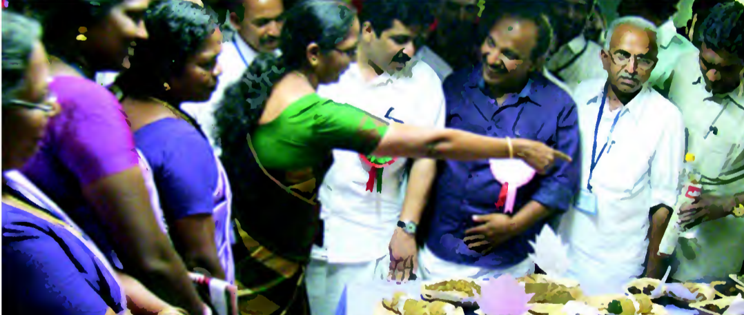
ഗ്രാമയാത്രയുടെ ഉദ്ഘാടനത്തോടനുബന്ധിച്ച് അന്നമനട പഞ്ചായത്തിലെ പുളിക്കടവ് പുഴയോരത്ത് സംഘടിപ്പിച്ച കുടുംബശ്രീ വിപണനമേള സന്ദർശിക്കുന്ന ഡോ.എം.കെ.മുനീർ