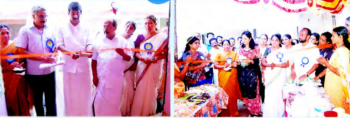
അമൃതം ന്യൂട്രിമിക്സ് ജില്ലാ കൺസോർഷ്യം ഓഫീസ് ഉദ്ഘാടനം കേന്ദ്ര ഉദ്യോഗസ്ഥന്മാർ കെ.സി. വേണുഗോപാൽ നിർവഹിക്കുന്നു.

മൂല്യവർദ്ധിത ഉൽപ്പന്നങ്ങളുമായി 'അമൃതം' യൂണിറ്റുകൾ