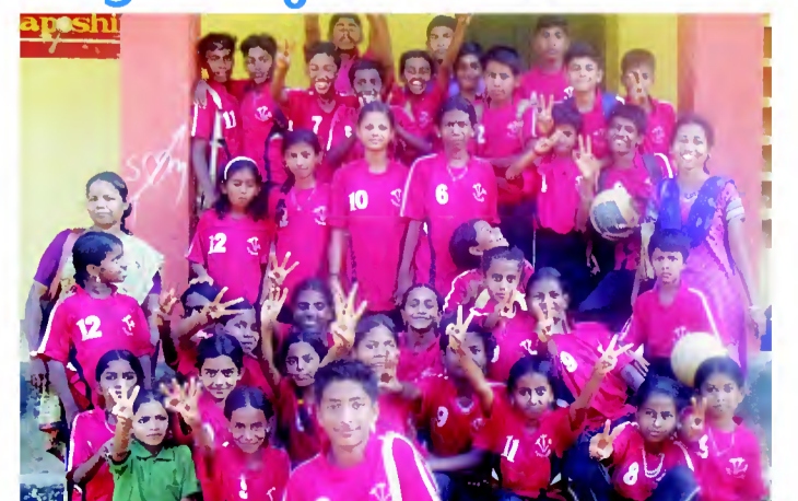
പാലക്കാട് ജില്ലാതല വോളിബോൾ ടൂർണമെന്റിൽ മികച്ച വിജയം നേടിയ ആലത്തൂർ ബ്ലോക്ക് പഞ്ചായത്ത് ബാലസഭ അംഗങ്ങൾ