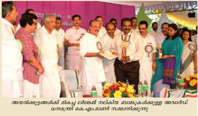
അയൽക്കൂട്ടങ്ങൾക്ക് മികച്ച ലിങ്കേജ് നൽകിയ ബാങ്കുകൾക്കുള്ള അവാർഡ് ധനമന്ത്രി കെ.എം.മാണി സമ്മാനിക്കുന്നു

മുൻ അത്താണിയായി മാറാൻ കുടുംബശ്രീക്ക് കഴിഞ്ഞിട്ടുണ്ട്. കേരളം കണ്ട ഏറ്റവും വലിയ സ്ത്രീ കൂട്ടായ്മയാണിത്. കുടുംബശ്രീ പ്രവർത്തകർ ഓരോരുത്തരും കുടുംബത്തിന്റെ വിളക്കുകളാണ്. സ്ത്രീകൾക്ക് സാധ്യമായ തയ്യാറെടുപ്പും സംഘടനാ ശക്തിയും നൽകാൻ കുടുംബശ്രീക്ക് കഴിഞ്ഞിട്ടുണ്ട്. ഇതോടൊപ്പം സ്വയം തൊഴിൽ വികസനത്തിനും കുടുംബശ്രീ വഴിയിലൂടെയും സാമ്പത്തിക പരിഹരിക്കുന്നതിന് സ്വയം തൊഴിൽവികസനത്തിലൂടെ മാത്രമേ കഴിയുകയുള്ളൂ. വീട്ടമ്മമാരായ സ്ത്രീകൾക്ക് സ്വന്തം വീട്ടുമുറ്റത്ത് തന്നെ തൊഴിൽ നൽകുന്നാപേജ് കാണുക