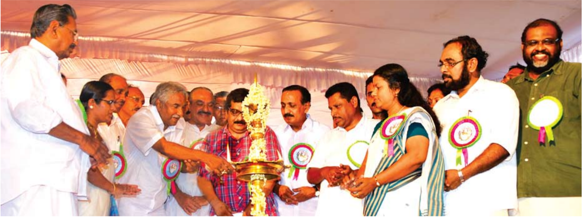
കുടുംബശ്രീ 15-ാം സംസ്ഥാനതല വാർഷികഘോഷങ്ങളുടെ സമാപന സമ്മേളനം കോഴിക്കോട് സ്വപ്നനഗരിയിൽ മുഖ്യമന്ത്രി ഉമ്മൻ ചാണ്ടി ഉദ്ഘാടനം ചെയ്യുന്നു

സ്ത്രീകളുടെ സംഘശക്തി വിളംബരം ചെയ്ത മുപ്പതിനായിരത്തിലധികം വരുന്ന കുടുംബശ്രീ പ്രവർത്തകരെ സാക്ഷി നിർത്തി കോഴിക്കോട് ജില്ലയിലെ സ്വപ്നനഗരിയിൽ കുടുംബശ്രീ പതിനഞ്ചാം സംസ്ഥാനതല വാർഷികഘോഷങ്ങൾക്ക് പ്രാവശ്യംഗമമായ സമാപനം. കുടുംബത്തിന്റെയും സമൂഹത്തിന്റെയും ഉന്നമനത്തിനായി കഠിനാധ്വാനവും ആത്മവിശ്വാസവും കൈമുതലാക്കി മുന്നേറി കേരളത്തിന്റെ വികസന ഭൂപടത്തിൽ തങ്ങളുടെ സ്ഥാനം അടയാളപ്പെടുത്തിയ സ്ത്രീകളുടെ സംഗമവേദിയാ