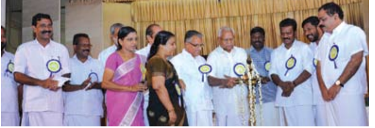
തൃശൂരിൽ കുടുംബശ്രീ 15-ാം ജില്ലാതല വാർഷികപരിപാടി മന്ത്രി സി.എൻ. ബാലകൃഷ്ണൻ ഉദ്ഘാടനം ചെയ്യുന്നു

സമൂഹത്തിൽ സ്ത്രീകളുടെ പദവി ഉയർത്തുന്നതിൽ കുടുംബശ്രീ ഗണ്യമായ പങ്ക് വഹിച്ചിട്ടുള്ളതായി മന്ത്രി സി.എൻ. ബാലകൃഷ്ണൻ പറഞ്ഞു. കുടുംബശ്രീയുടെ പതിനഞ്ചാം വാർഷികാഘോഷത്തിന്റെ ഭാഗമായി കൊല്ലത്ത് ജില്ലാതല വാർഷികപരിപാടി ഉദ്ഘാടനം ചെയ്യുകയായിരുന്നു അദ്ദേഹം. മികച്ച പ്രവർത്തനം നടത്തിയ മുള്ള, മുരിയാട്, നടത്തറ, വരവൂർ, വേ