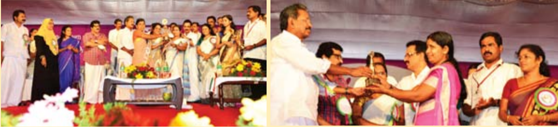
മികച്ച ഗ്രാമ സി.ഡി.എസുകൾക്കുള്ള അവാർഡുദാനം മന്ത്രി പി. കെ. ജയലക്ഷ്മിയും മികച്ച നഗര സി.ഡി.എസുകൾക്കുള്ള അവാർഡ് ദാനം എം.ഐ ഷാനവാസ് എം.പിയും നിർവഹിക്കുന്നു.

കുടുംബശ്രീ 15-ാം സംസ്ഥാനതല വാർഷികാഘോഷങ്ങളോടനുബന്ധിച്ച് 2012-2013 സാമ്പത്തിക വർഷത്തിൽ സംസ്ഥാനത്ത് ഏറ്റവും മികച്ച പ്രവർത്തനം കാഴ്ചവച്ച ഗ്രാമ-നഗര സി.ഡി.എസുകൾക്ക് പുരസ്കാരം നൽകി. മികച്ച സി.ഡി.എസുകൾക്ക് 2,75,000 രൂപയുടെ കാഷ് അവാർഡും ശില്പവും പ്രശസ്തിപത്രവും അടങ്ങുന്ന അവാർഡ് വാർഷിക സമാപന സമ്മേളനത്തിൽ സമ്മാനിച്ചു.