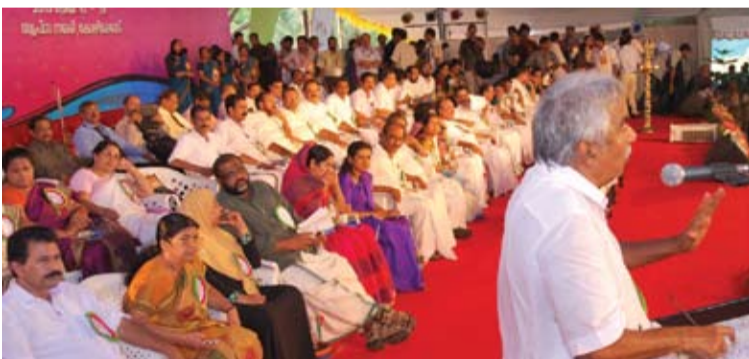
കുടുംബശ്രീ 15-ാം സംസ്ഥാനതല വാർഷികഘോഷങ്ങളുടെ സമാപന സമ്മേളനത്തിൽ മുഖ്യമന്ത്രി ഉമ്മൻ ചാണ്ടി സംസാരിക്കുന്നു

കേരളത്തിൽ വിജയം വരിച്ച കുടുംബശ്രീയെ രാജ്യവ്യാപകമാക്കുകയാണ് ലക്ഷ്യമെന്ന് മുഖ്യമന്ത്രി ഉമ്മൻ