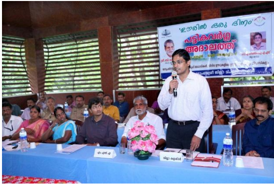
Presided by District Collector

Ooril oru dinam tribal adhalath conducted at Vazhachal on 25.08.2016 for Mukkampuzha, Vazhachal, Pokalappara, Peringalkuthu, Vachumaram, Thavalakuzhippara and Anakkayam ST Colonies. 230 members were participated. 32 Departments involved in the adhalath. District collector presided the adhalath, MLA Inaugurated, block panchayath president and other elected representatives, ST promoters, Oorumooppanand other departmental officials were participated