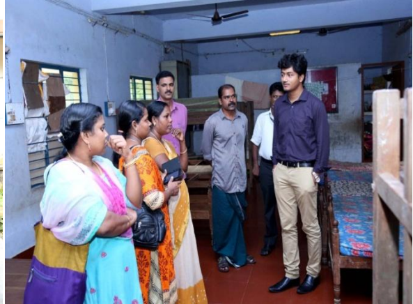
Tribal Hostel Visit