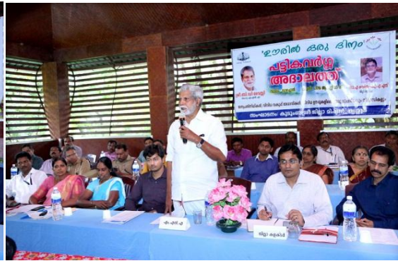
Inaugurated by Chalakyudi MLA