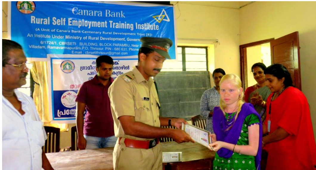
Certificate Distribution by VSS Secretary