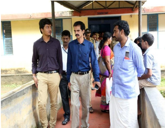
Tribal School Visit