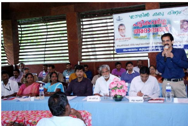
Speech by DLSA –Sub Judge