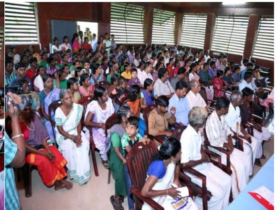
Ooril Oru dinam - Participants