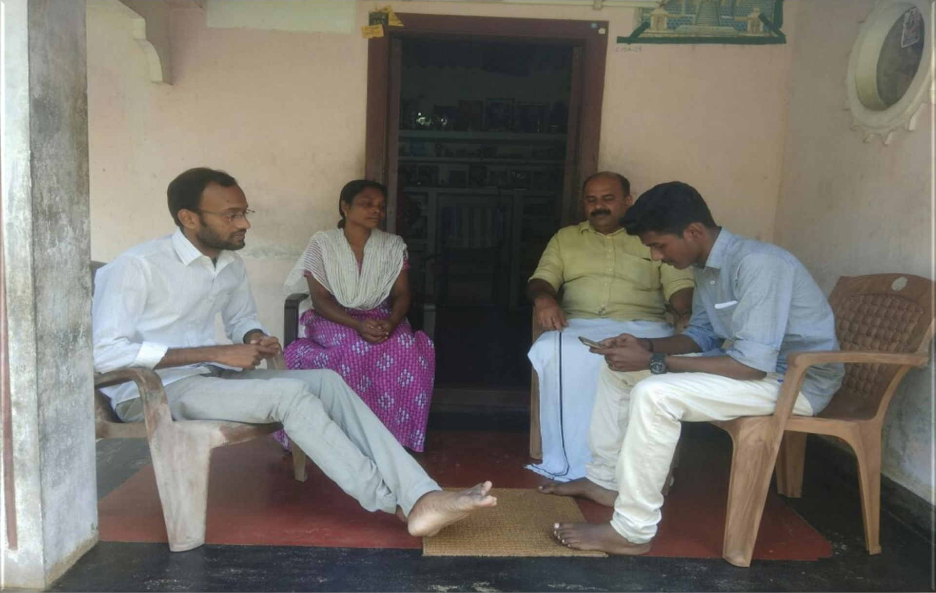
അഗതിരഹിതകേരളം മൊബൈൽ സർവ്വെ