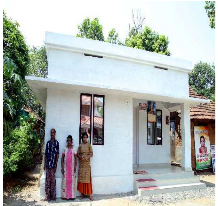
House constructed under "Swapnakoodu" project of Panchayat