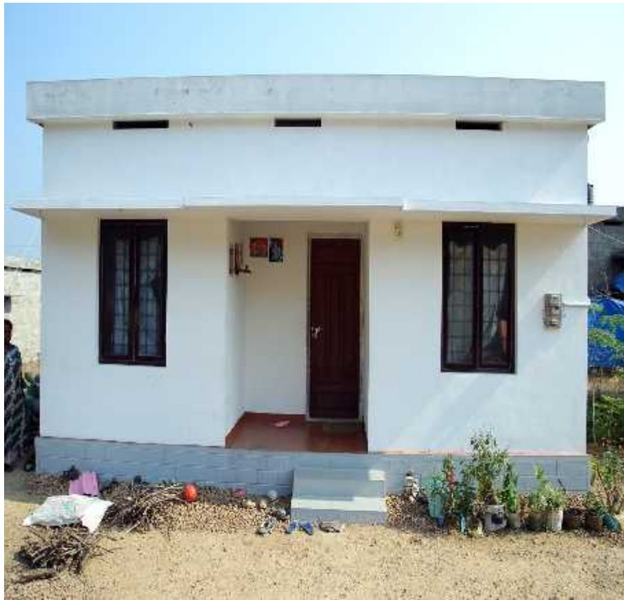
House Constructed for Asraya Beneficiary Mooknanur Panchayat